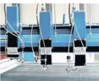
Zur wirtschaftliche Bearbeitung von Teilen: Arbeitsflächen mit Mehrschneidköpfen.

Produktionshalle und den Ausbau von Reserveflächen sowie den Erwerb einer hochmodernen Laserschneideanlage und eines CNC-Bearbeitungszentrum hat die Firma WST den Grundstein für den Ausbau des Betriebes gelegt. Ein weiterer Ausbau, der mittelfristig schon geplant ist, wird wohl aus Platzgründen nicht mehr am bisherigen Firmensitz in Wessum möglich sein. Der